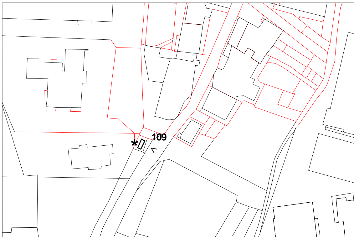
Estratto catastale in scala 1:1.000

☺ < Punto di vista dell'immagine fotografica.